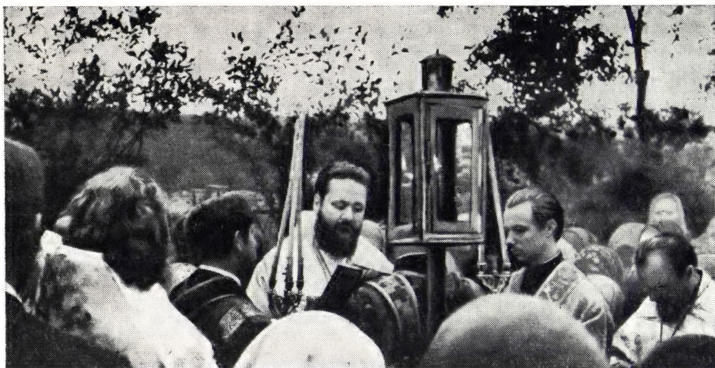
Епископ Зарайский Хризостом за богослужением в день празднования 100-летия храма в с. Турбичево

Таин. После литургии было совершено окропление святой водой храма и молящихся и возгласены уставные многолетия. В проповеди архипастырь подчеркнул необходимость заботы христиан о храме, в котором сосредоточены духовные сокровища христианина, и прежде всего таинства Церкви. Владыка привел слова Спасителя: «Где соковище ваше, там будет и сердце ваше» (Мф. 6, 21). После проповеди молящиеся подходили под благословение к епископу Хризостому.